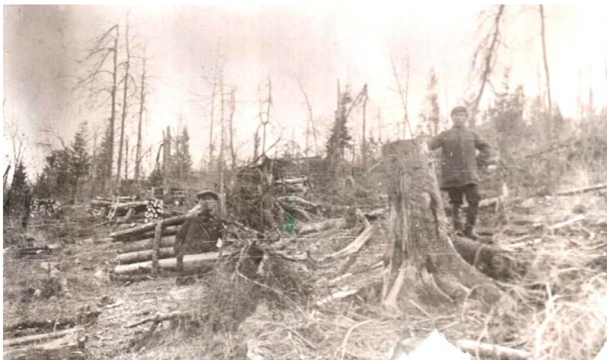
Вырубка леса. 1931 год.