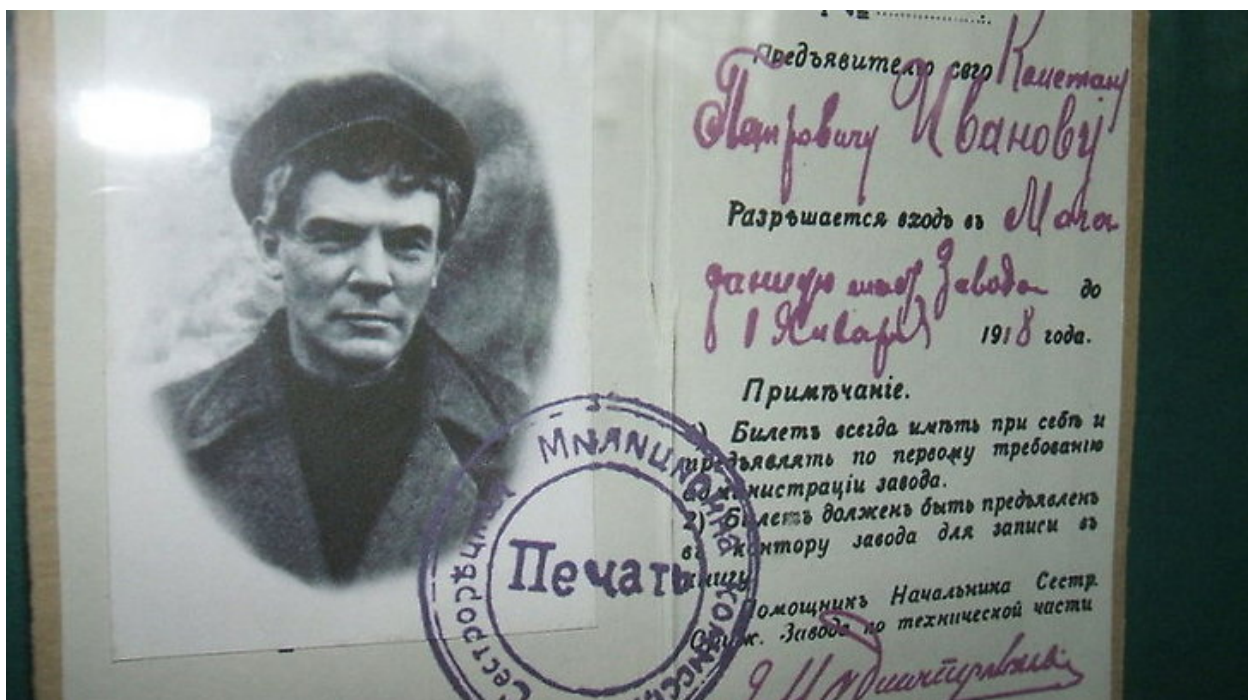
Удостоверение, которым В.И. Ленин пользовался в начале 1917 года.

В статье: «Наброски программы экономических мероприятий» – Ленин одну из задач основанного им государства определил так: «Централизация потребления путем принудительного объединения в потребительные общества». (22 ноября 1917 года). Развивая свою мысль, в проекте одного из декретов он отметил: «...потребительные общества национализируются, обязуясь включить в свой состав все население данной местности поголовно». (24 – 27 декабря 1917 года). В проекте другого декрета им же написано: «Вводится всеобщая трудовая повинность. Все лица обоего пола с 16 до 55 лет обязаны выполнять те работы, которые будут назначаться... органами советской власти». (14 декабря 1917 года).