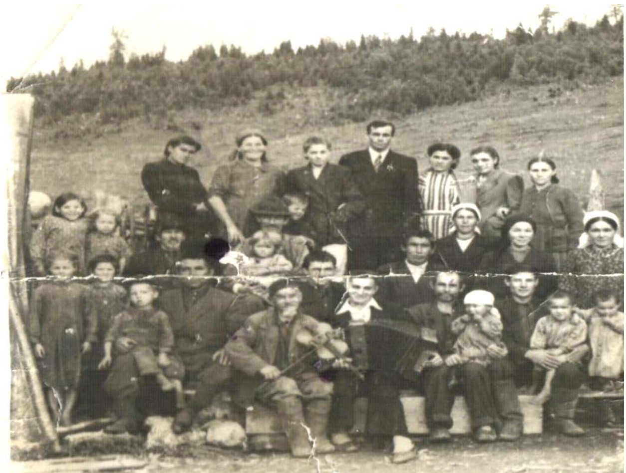
Репрессированные жители спецпосёлка Берёзовый Лог.

В конце двадцатых годов и в Башкирии началась коллективизация, а вместе с ней – раскулачивание. Ученые мужи исписали по этому поводу горы бумаги. Многие стали докторами. Некоторые, во второй половине восьмидесятых лукаво переписавшие старые диссертации, были обласканы и демократами.