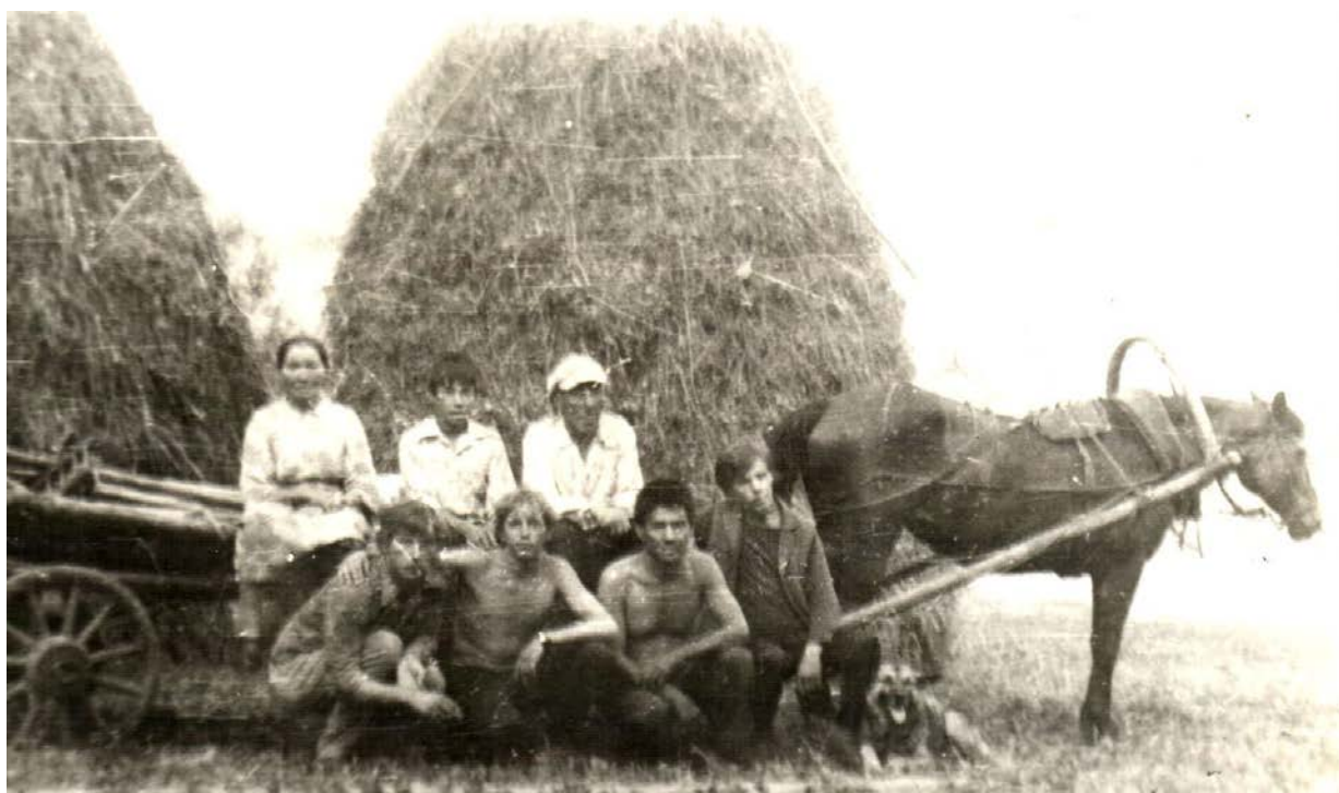
Фотоархив магинской школы. Жители Берёзового Лога на заготовке сена.

обзавелись огородами. У многих появился скот. Конечно, очень трудно было накопить деньги на покупку коровы, и даже телки.